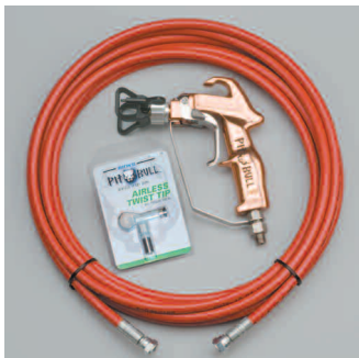
N° Rif. A3500-2-75 Kit pistola, tubo e porta ugello reversibile (ugello incluso)