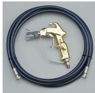
N° Rif. A3500-2-75 Kit pistola, tubo e porta ugello reversibile (senza ugello)